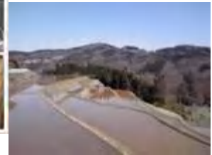
岡山県美咲町にて人材育成、組織活性、復職支援プログラムを展開中